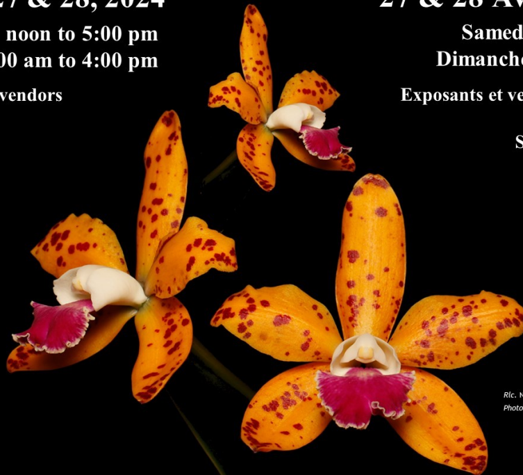
Ric. Naomi's Delight

PHOTOGRAPHERS: TRIPODS WELCOME SUNDAY 9-11 AM