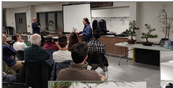
Tree presentation Présentation d'arbres