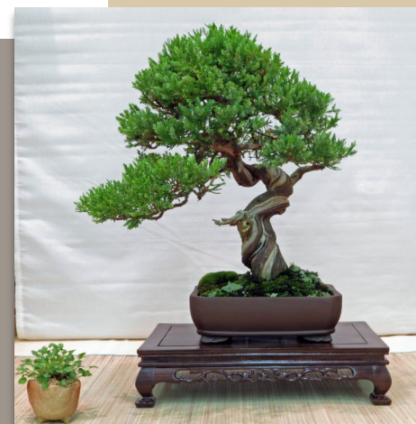
After - Après