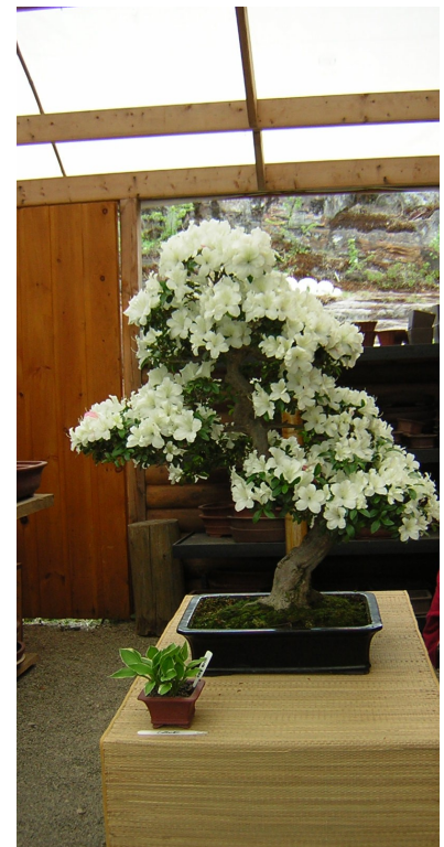
Azalea - Azalée

En octobre, nous reprendrons notre programme de présentations mensuelles de bonsaï en ligne sur Zoom jusqu'à ce que les directives sanitaires nous permettent de nous rencontrer à nouveau en personne. La première de ces présentations de la saison 2021-2022 est prévue le lundi soir 18 octobre. De plus amples détails seront fournis dans le bulletin d'octobre.