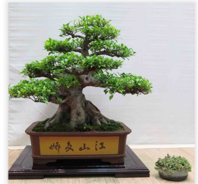
Ficus in exhibition