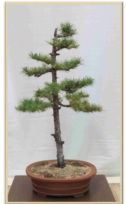
Larch - Mélèze