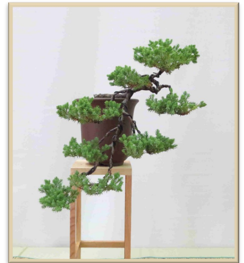
Garden Juniper - Genévrier prostré