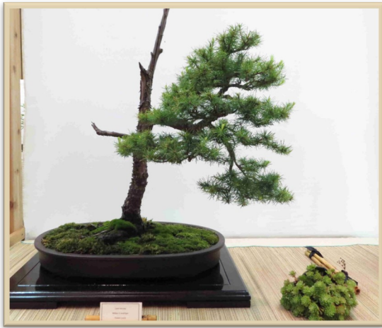
Larch - Méléze