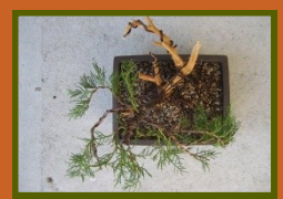
Transformation of a Junniper