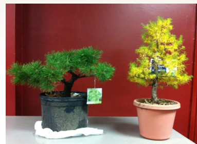
Hybrid Japanese Red Pine / Larch

In the second portion of the meeting, we saw the evolution of a collected larch. Members were able to see early pictures of the tree from different angle before a front was chosen. Vianney explained that a major feature was key in choosing the front. A sketch of the intended design was presented along with some of the techniques used in the first