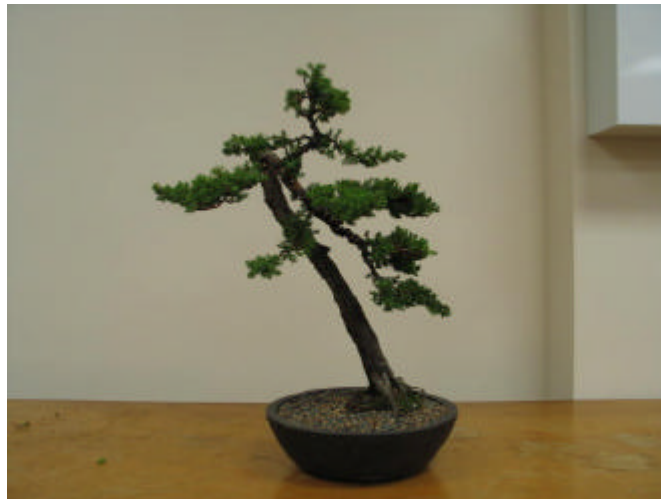
Japanese Garden Juniper , after styling and potting by Barney

This will be an excellent opportunity to learn about developing your own bonsai using propagation methods.