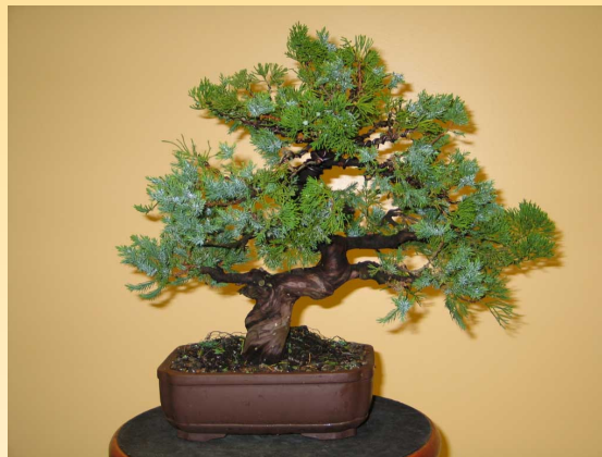
Before / Avant