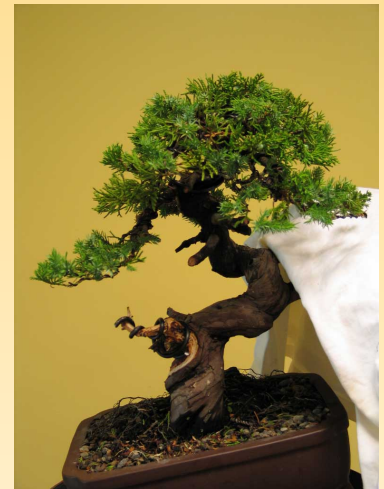
After / Après