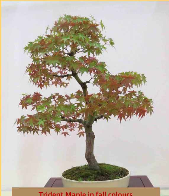
Trident Maple in fall colours