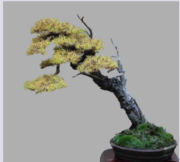
Larch in fall colours