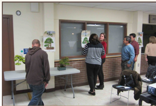
Participants - OBS course

challenge and it does require an understanding of proper techniques. The entire meeting was spent discussing the different techniques applicable to