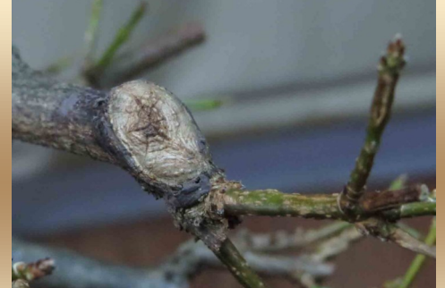
Good callus—Top view