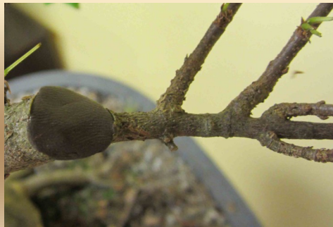
With cut paste